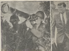
Riba e grafico aki nos ta mira president Kennedy, algun rato despues cu el a tuma e decison pa cera tropanan comunistas pa Thailandia. Banda di dje un infante di marina maricano, cu a ocupa un puesto na e frontera.

Esey automaticamente a crea e peligro cu e guerrilleros comunista taube cruzá e frontera di Thailandia y aki ta yega na otro aspecto. Asina e tropanan comunista cruzá frontera di Thailandia, esey lo mieda un agresion contra Thailandia. Vanes añá pasá Thailandia a cera un pacto cu Estados Unidos, Pakistan, Filipinas, Inglaterra y Australia y e pacto ey ta hea cu si un di e paizan ey worde atacá dje di un nacion comunista, e ataque ey lo worde considerá como un ataque contra tur e seis paizan, di manera cu tur lo enfrenta e ataque comunista.